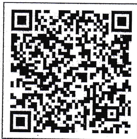
สแกน QR-Code เพื่อสมัครเข้าประกวด